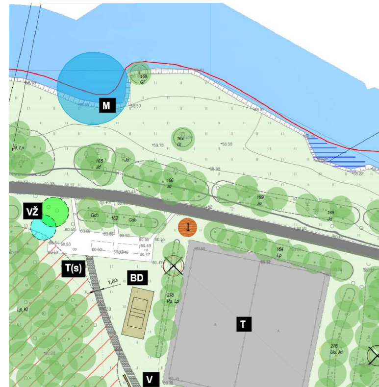
IŠTRAUKA IŠ MARIJAMPOLĖS PAŠEŠUPIO PARKO KRAŠTOVAIZDŽIO TVARKYMO PROJEKTO

ŽEMĖS SKLYPAS Adresas: R. Juknevičiaus g. 114, Marijampolė, Unikalus Nr. 4400-2204-2133. Pagrindinė naudojimo paskirtis - kita, žemės sklypo naudojimo būdas - bendro naudojimo (miestų, miestelių ir kaimų ar savivaldybių bendrojo naudojimo) teritorijos, plotas - 0,0866 ha. Marijampolės miesto teritorijos bendrasis planas nustato, kad tai vidutinio užstatymo intensyvumo gyvenamoji zona, kurioje taip pat galimas komercinis žemės naudojimo būdas.