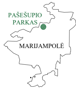
SITUACIJOS SCHEMA, M1:200000