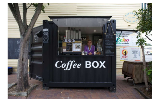
GALIMI LAIKINOJO STATINIO VIZUALINIAI SPRENDIMAI