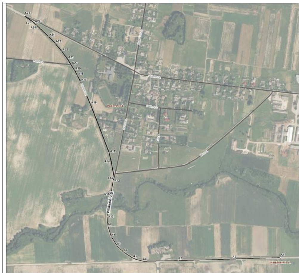
Padovinio k. gatvių išdėstymo planas M 1:5000

Dokumentų parangė: Vyr. paminklotvarkininkas GEDEMINAS KUNCAITIS