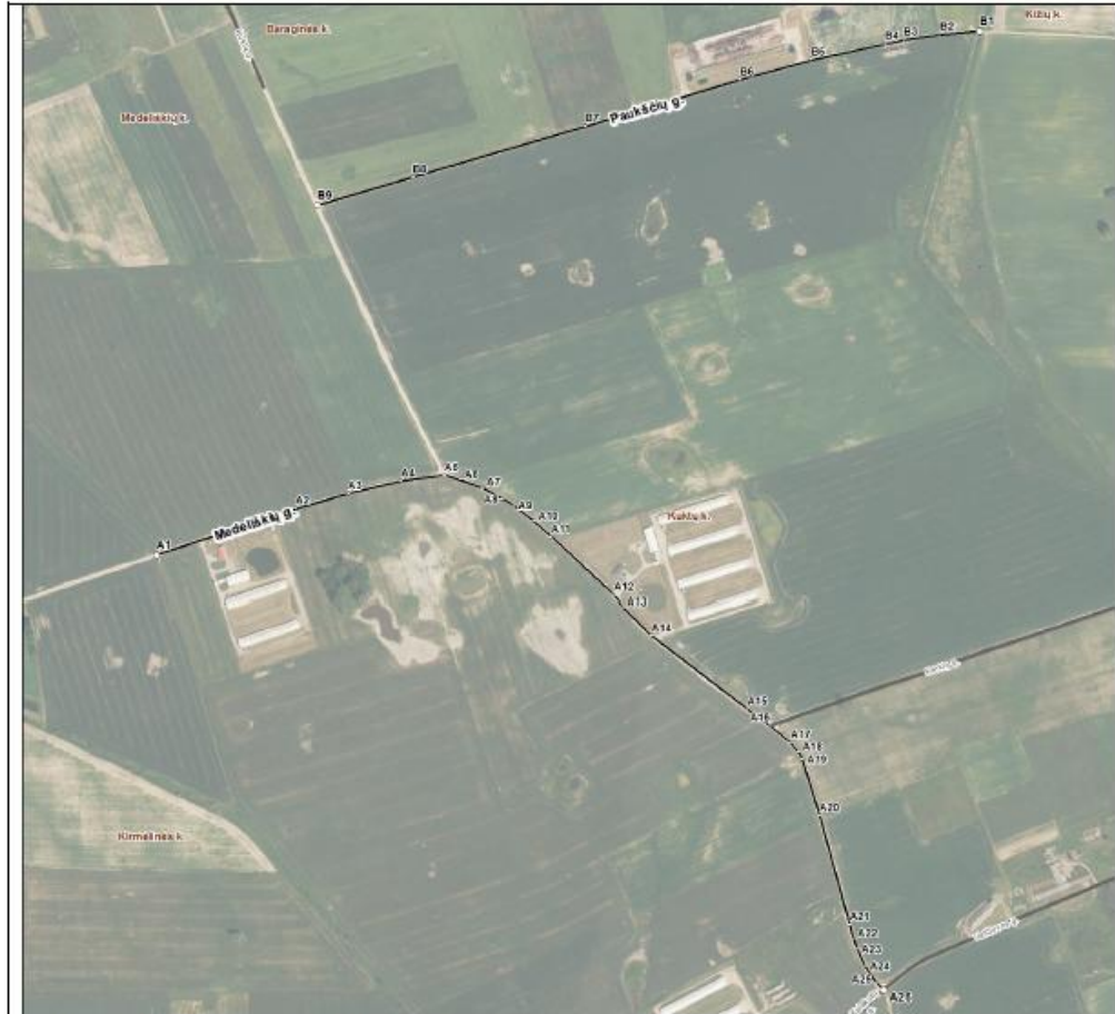
Kultū k. gatvių išdėstymo planas M 1:7500

Dokumento autorius: Vyr. specialistas/inžinierius: GEDEMINAS KUNCAITIS