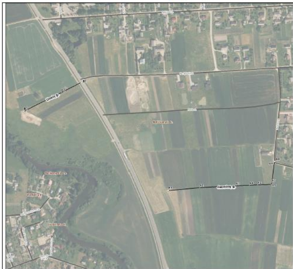
Netičkampio k. gatvių išdėstymo planas M 1:3500

Dokumentą parngė: Vyr. paisiokitvarkininkas GEDEMINAS KUNCAITIS