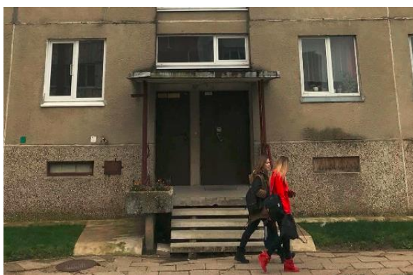
5 pav. Įėjimo durys