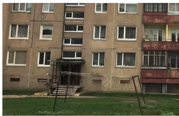
6 pav. Cokolis