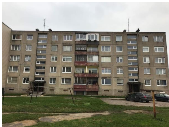
1 pav. Pastato priekinis fasadas