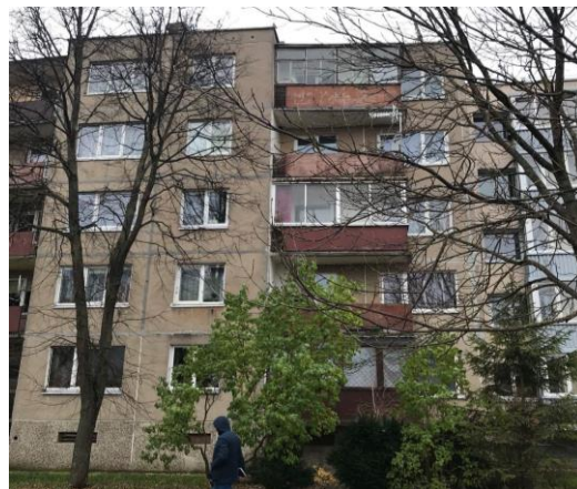
2 pav. Pastato galinis fasadas