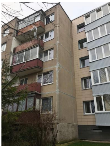
3 pav. Pastato šoninis fasadas