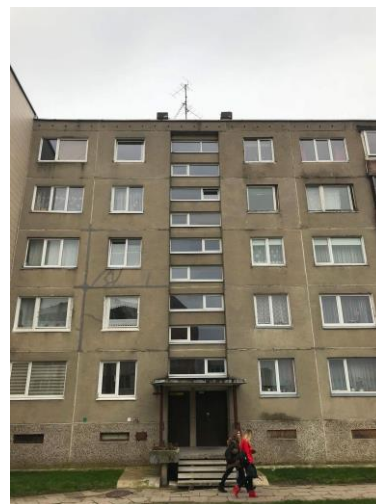
4 pav. Laiptinės langai