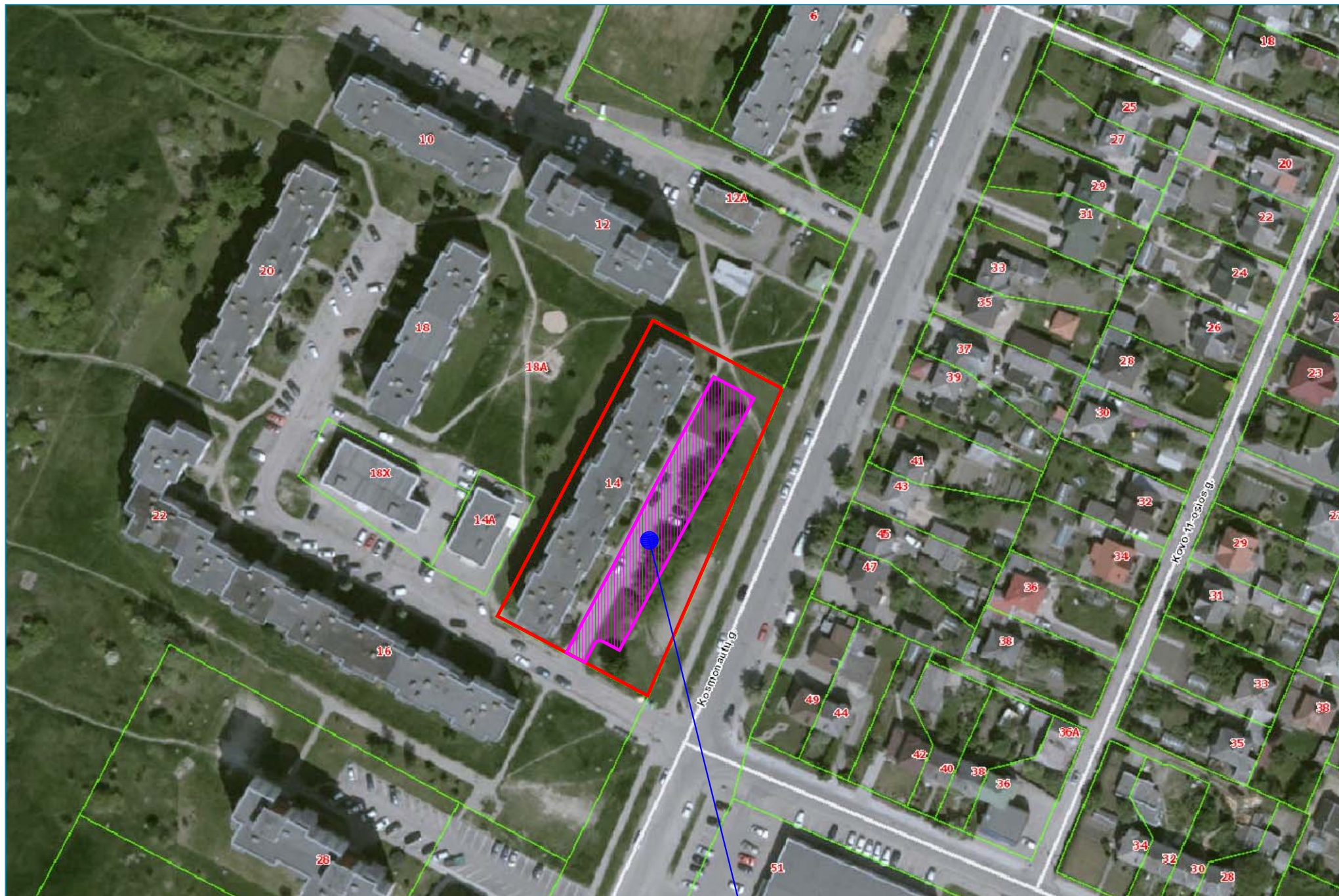
REKONSTRUOJAMA AUTOMOBILIŲ STOVĖJIMO AIKŠTELĖ