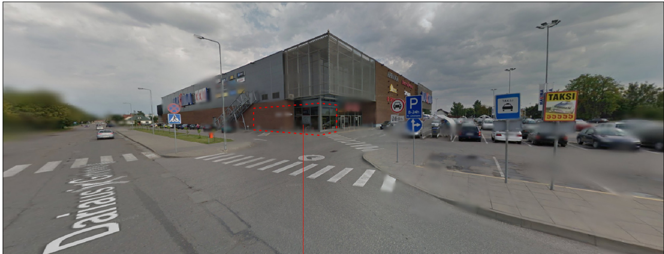
TURTINIO VIENETO NR. 2 - KITOS PASKIRTIES - LOŠIMO AUTOMATŲ SALONO PATALPŲ VIETA