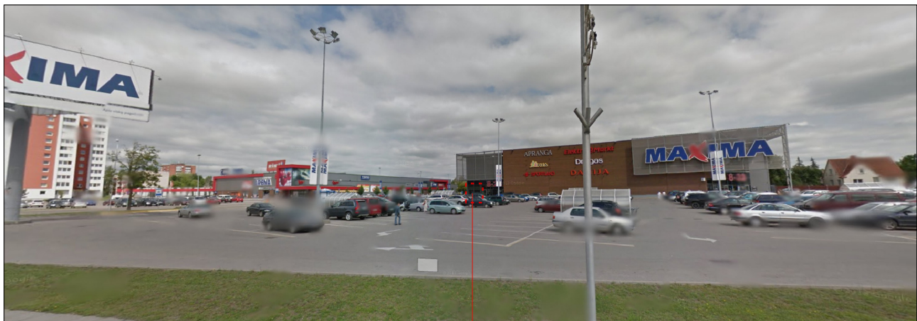
TURTINIO VIENETO NR. 2 - KITOS PASKIRTIES - LOŠIMO AUTOMATŲ SALONO PATALPŲ VIETA