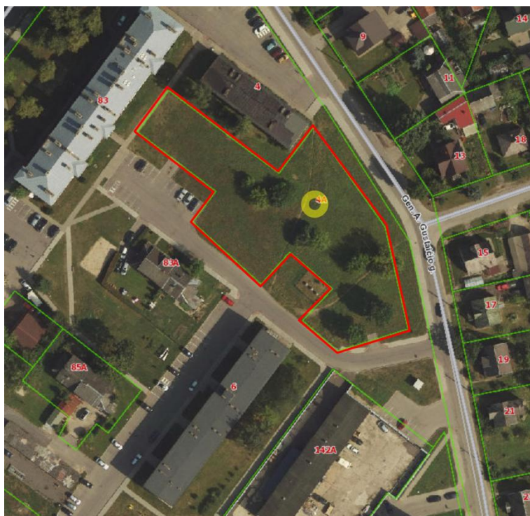
— pertvarkoma teritorija Marijampolėje, Gen. A. Gustaičio g. 4A

IŠTRAUKA IŠ MARIJAMPOLĖS MIESTO TERITORIJOS BENDROJO PLANO, PATVIRTINTO MARIJAMPOLĖS SAVIVALDYBĖS TARYBOS 2017 M. RUGSĖJO 25 D. SPRENDIMU NR. 1-229