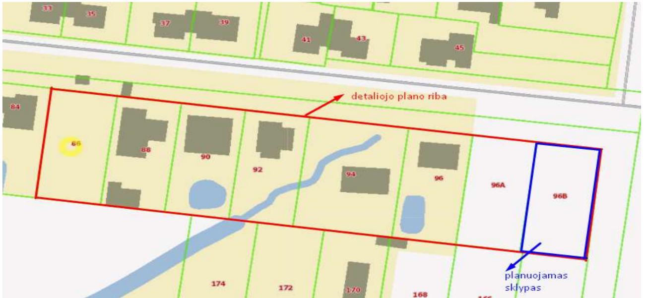
IŠTRAUKA IŠ MARIJAMPOLĖS MIESTO TERITORIJOS BENDROJO PLANO, PATVIRTINTO MARIJAMPOLĖS SAVIVALDYBĖS TARYBOS 2017 M. RUGSĖJO 25 D. SPRENDIMU NR. 1-229